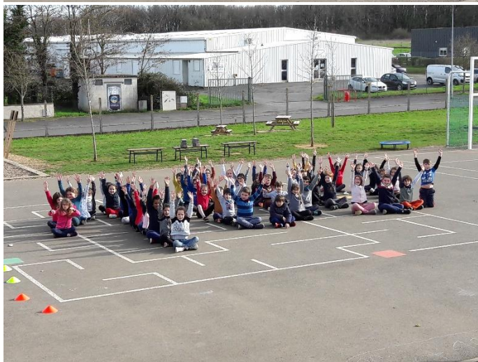
Les élèves de CP