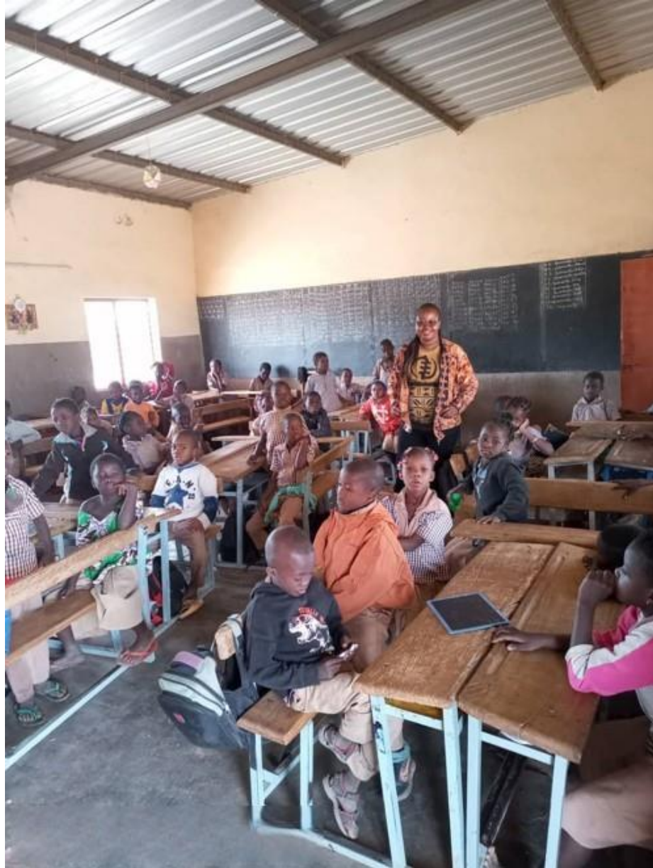
Classe de CP2